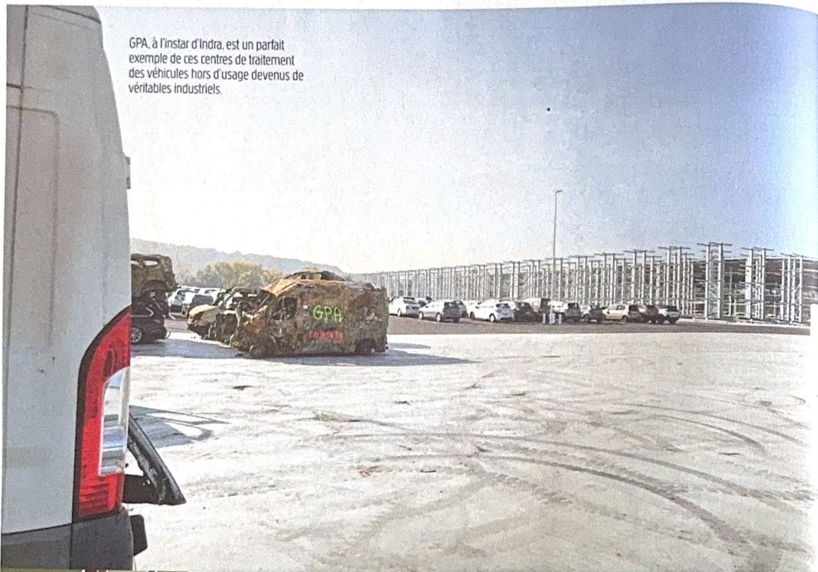
GPA, à l'instar d'Indra, est un parfait exemple de ces centres de traitement des véhicules hors d'usage devenus de véritables industriels.

Quand certains centres de traitement des véhicules hors d'usage (VHU) font le choix de perdurer leur fonctionnement historique, d'autres optent pour une modernisation de leurs activités. C'est tout l'écosystème de la pièce issue de l'économie circulaire (PIEC) qui s'adapte à cette professionnalisation pour aller de l'avant. Au risque de laisser quelques professionnels sur le bas-côté.